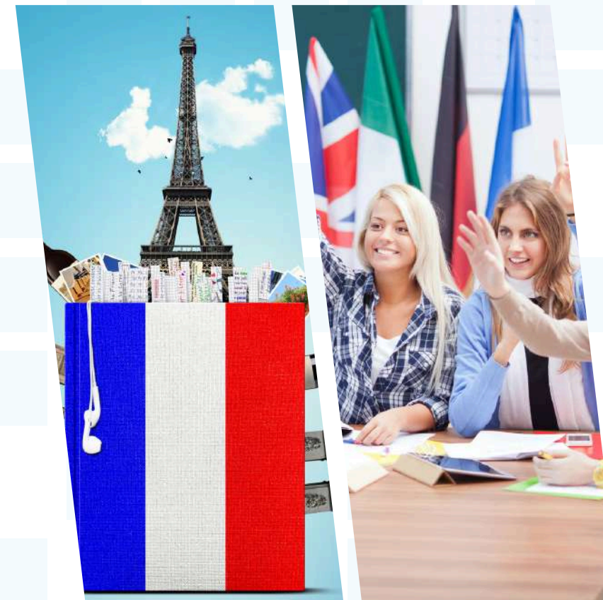
Licenciatura en Idiomas